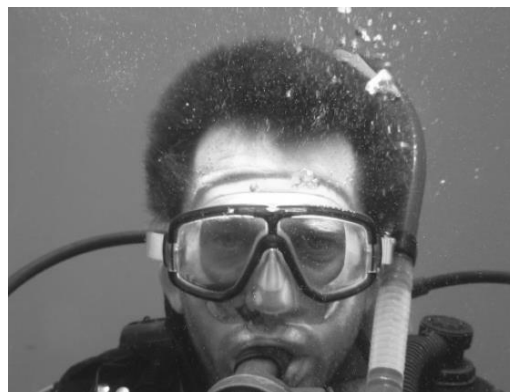
Figura 3 – Mergulhador com barotrauma dos seios perinasais – sangue na máscara [16]

Como já referido anteriormente, os mergulhadores sentem uma dor na região frontal na maior parte das vezes. Porém, quando realizadas radiografias, constata-se que as lesões