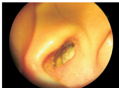
Figura 2 – Otomicose à otoscopia [15]

Existem vários factores predisponentes ao desenvolvimento de uma otomicose, nomeadamente excesso de cerúmen (propicia o crescimento de fungos), instrumentalização do ouvido, imunossupressão ou utilização recente de corticóides